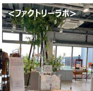
<ファクトリーラボ>

入口で入場券が必要です。入場料は3つのコントリビューション先（寄贈）を選ぶことができます。