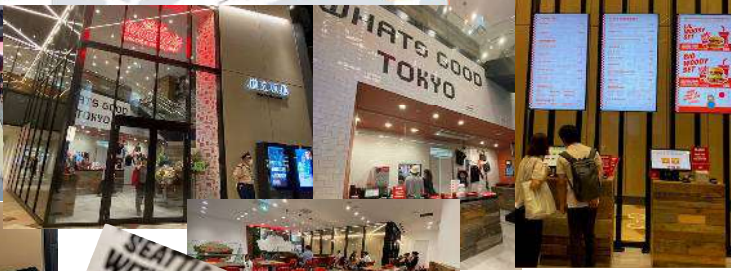
←1階でオーダー 客席は2階

↑●「ザ シティ ベーカリー (THE CITY BAKERY)」 ●「猿田彦珈琲」正面エントランスは、人気の2店舗が出店。