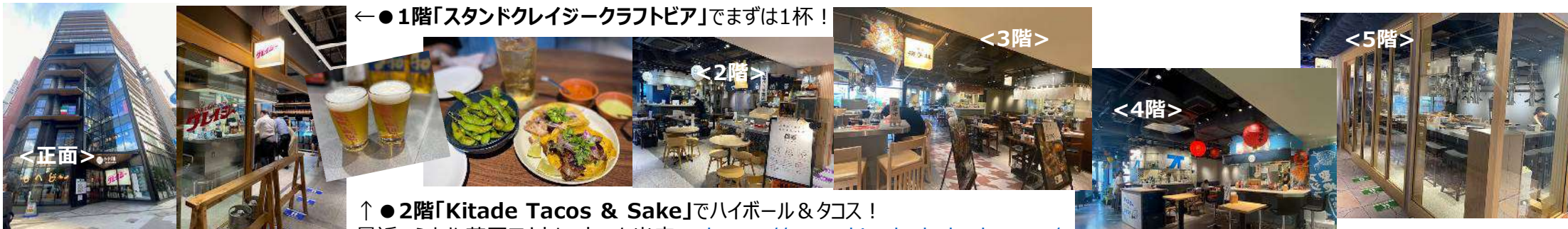
←●1階「スタンドクレイジークラフトビア」でまずは1杯！

人形町交差点に面した立地に都市型商業施設「M's CROSS (エムズクロス) 人形町」(地上10階)が2023年7月6日に開業。1～5階は、横丁スタイルの飲食ゾーン「ハシゴ楼」。地元の繁盛店をはじめ全国の人気店や、幅広いジャンルの18店舗が飲食店が出店。全店舗オールキャッシュレス、営業時間は個々に異なるので事前チェックを。館内はエレベーターのみ。外階段で上下階を移動するのが少し不便に感じました。所感：ハシゴするには、単価が高めに感じました。 https://www.hashigoro.jp/