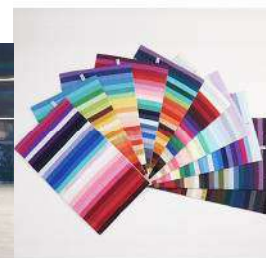
簡単にパーソナルカラーが分かる パーソナルカラーフラッグ®