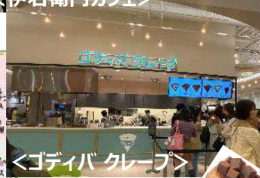
<ゴディバ クレープ>

南町田グランベリーパーク、ららぽーと富士見に次ぐ3店舗目。大人気！でした。 https://www.godiva.co.jp/godiva_crepe/