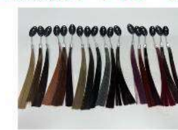
新開発のヘアカラー毛束