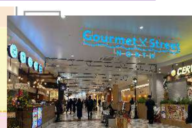
<Gourmet Street エントランス>