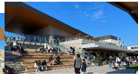
<大階段・ウッドデッキ広場>