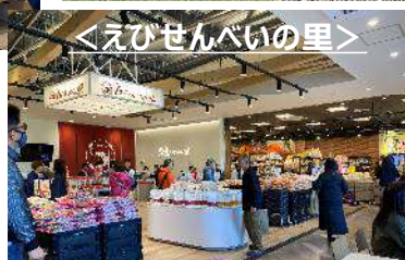
<えびせんべいの里>