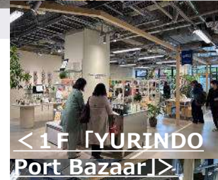
<1F「YURINDO Port Bazaar」>