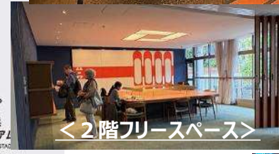
<2階フリースペース>

↑ブランド初となるベーカリーを併設。宿泊以外のお客さまも自由に利用できる、ロビー、フリースペースや休憩スペースが充実しています。