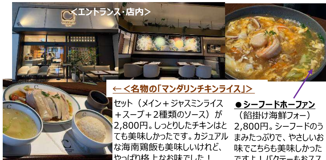
←＜名物の「マンダリンチキンライス」＞

1971年、シンガポールの名門ホテル「マンダリン・オーチャード・シンガポール（現：ヒルトン・シンガポール・オーチャード）」にて誕生。屋台料理として親しまれてきた海南鶏飯（チキンライス）をはじめとする屋台料理を、ホテルレストランの舞台へ引き上げ、ローカルフードから“国際料理”へと押し上げた先駆的ブランド。丸ビル店は、日本国内における旗艦店として、香港・マカオ・フィリピン・台湾に続くアジア展開の新たな拠点となる店舗です。4月に伺いましたが、予約がおススメ。一人より複数名でシェアがいいですよ。どれも美味しそうで食べてみたかったです。入り口付近はカウンター席で、ちょっとリッチなランチタイムを過ごされているお一人様もいらっしゃいました。 運営会社：アイエムエムフードサービス株式会社（本社：石川県金沢市） https://immfoodservice.com/ https://chatterboxcafe.jp/