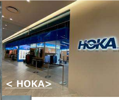
< HOKA >