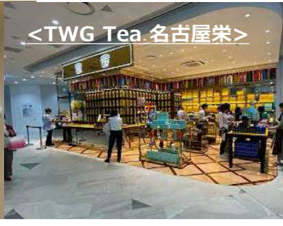
<TWG Tea 名古屋栄>