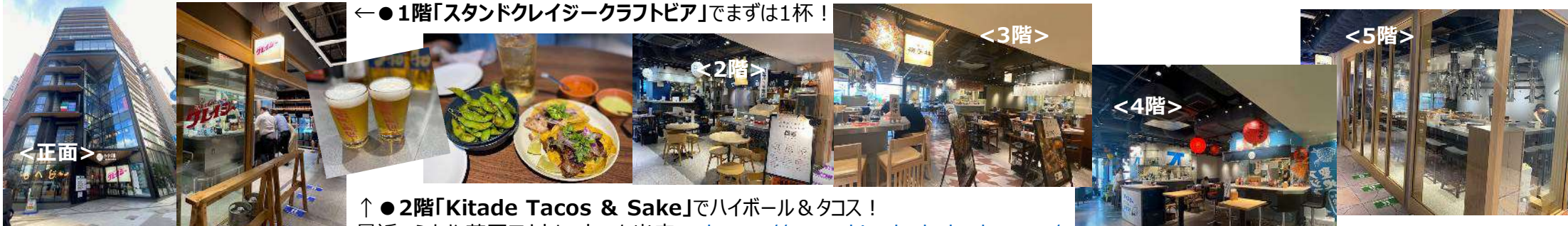
←●1階「スタンドクレイジークラフトビア」でまずは1杯！

人形町交差点に面した立地に都市型商業施設「M's CROSS (エムズクロス) 人形町」(地上10階)が2023年7月6日に開業。1～5階は、横丁スタイルの飲食ゾーン「ハシゴ楼」。地元の繁盛店をはじめ全国の人気店や、幅広いジャンルの18店舗が飲食店が出店。全店舗オールキャッシュレス、営業時間は個々に異なるので事前チェックを。館内はエレベーターのみ。外階段で上下階を移動するのが少し不便に感じました。所感：ハシゴするには、単価が高めに感じました。 https://www.hashigoro.jp/