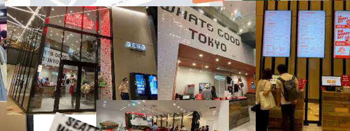
←1階でオーダー 客席は2階