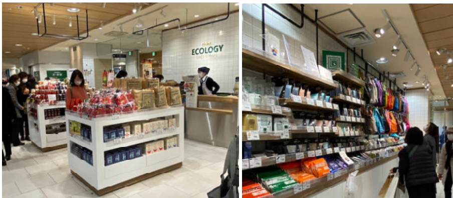
●エコバックコーナー ↑ 雑貨・エコバッグが約160アイテム。

https://www.komatsumatere.co.jp/mono-bo/